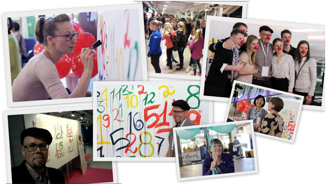
Kuva 1. Finlandia Trophyn (2014) Luovuuspajan eri tilanteita ja tunnelmia kilpailun numeroarvonnasta.

Omannäköisen ja -värisen kilpailunumeron maalaaminen samanaikaisesti ja yhdessä muiden urheilijoiden kanssa rohkaisi urheilijaa itsenäiseen suoritukseen ja loi ryhmähenkeä.