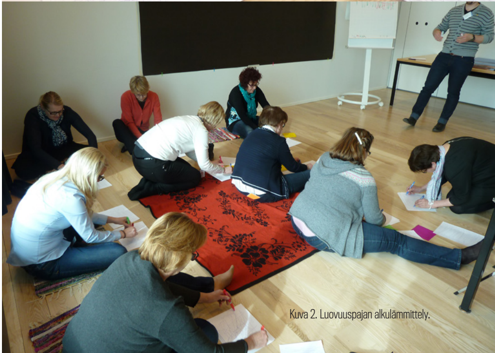
Kuva 2. Luovuuspajan alkulämmittely.